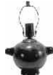
13 803 00 HANDEL 2 A/B: 330 / 170 mm C: 100 mm