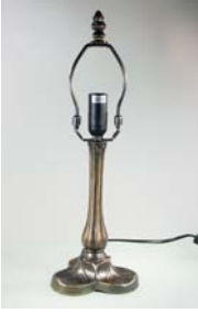
13 713 00 Zink Fuß 333 34,0 cm mit Elektrik Zinc base 333 13,4" wired