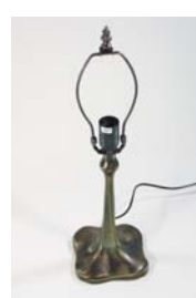
13 730 00 Zink Fuß OT-025 49,0 cm mit Elektrik Zinc base OT-025 19,3" wired