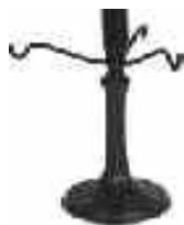
13 807 01 HANDEL 3 A/B: 260 / 150 mm C: 110 mm