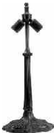
13 811 00 MILLER 1 A/B: 600 / 360 mm C: 245 mm