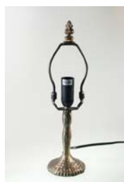
13 705 00 Zink Fuß 308 SS 27,0 cm mit Elektrik Zinc base 308 SS 10,6" wired