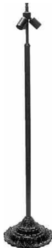
13 818 00 GENERIC 2 A/B: 1360 / 1160 mm C: 300 mm