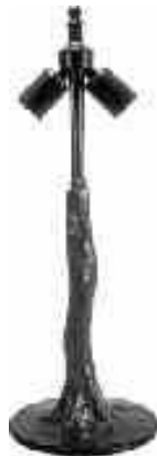
13 801 00 HANDEL 1 A/B: 540 / 330 mm C: 200 mm