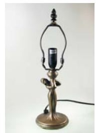
13 718 00 Zink Fuß 520 S 31,0 cm mit Elektrik Zinc base 311 12,2" wired