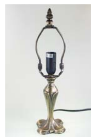
13 727 00 Zink Fuß B 118S 50,0 cm mit Elektrik Zinc base B 118S 19,7" wired