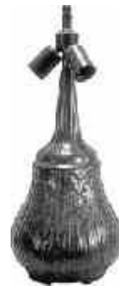
13 838 00 HANDEL 8 A/B: 520 / 300 mm C: 220 mm