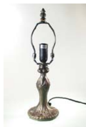
13 708 00 Zink Fuß 311S 31,0 cm mit Elektrik Zinc base 311S 12,2" wired