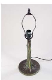
13 728 00 Zink Fuß 203 53,5 cm mit Elektrik Zinc base 203 21,1" wired