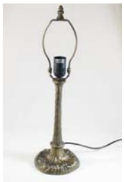
13 716 00 Zink Fuß 383 49,0 cm mit Elektrik Zinc base 383 19,3" wired