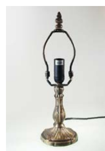
13 712 00 Zink Fuß 329A 28,0 cm mit Elektrik Zinc base 329A 11,0" wired