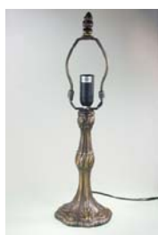
13 704 00 Zink Fuß 308 35,0 cm mit Elektrik Zinc base 308 13,8" wired