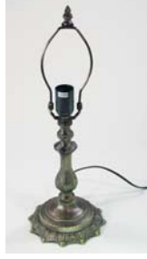
13 714 00 Zink Fuß 342 46,5 cm mit Elektrik Zinc base 342 18,3" wired