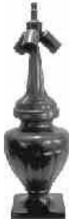
13 836 00 HANDEL 6 A/B: 590 / 350 mm C: 160 mm