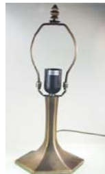
13 720 00 Zink Fuß 532 37,0 cm mit Elektrik Zinc base 532 14,6" wired