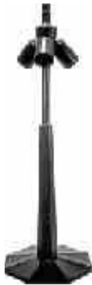
13 870 00 GENERIC 3 A/B: 540 / 340 mm C: 210 mm