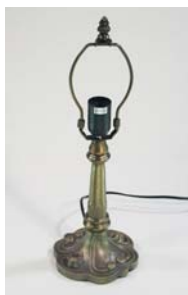
13 723 00 Zink Fuß 609 42,5 cm mit Elektrik Zinc base 609 16,7" wired