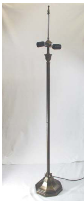
13 732 00 Zink Fuß TB-105 142,0 cm mit Elektrik Zinc base TB-105 56,0" wired