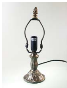
13 725 00 Zink Fuß 922 25,0 cm mit Elektrik Zinc base 922 9,8" wired