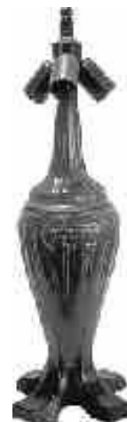
13 837 00 HANDEL 7 A/B: 620 / 350 mm C: 210 mm