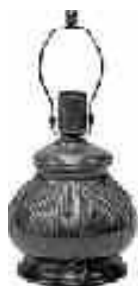
13 813 00 TIFFANY I A/B: 370 / 210 mm C: 150 mm