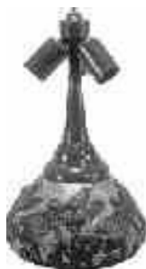
13 842 00 TIFFANY DRAGONFLY A/B: 390 / 220 mm C: 210 mm