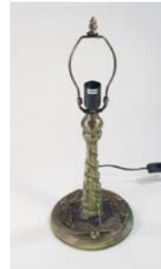
13 724 00 Zink Fuß 704L 52,5 cm mit Elektrik Zinc base 704L 20,7" wired