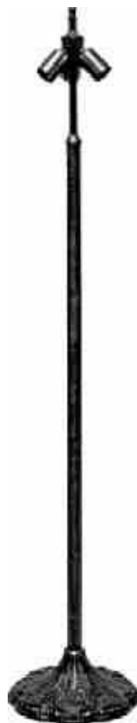
13 817 00 GENERIC I A/B: 1350 / 1130 mm C: 250 mm