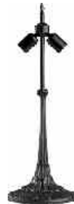
13 805 00 WILKINSON 2 A/B: 550 / 350 mm C: 200 mm