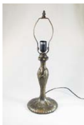
13 707 00 Zink Fuß 311B 53,5 cm mit Elektrik Zinc base 311B 21,1" wired