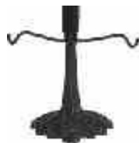
13 825 00 HANDEL 8 A/B: 260 / 150 mm C: 110 mm