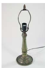
13 729 00 Zink Fuß H 321 47,0 cm mit Elektrik Zinc base H 321 18,5" wired