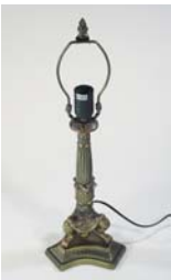
13 719 00 Zink Fuß 524 A 51,5 cm mit Elektrik Zinc base 311B 20,3" wired