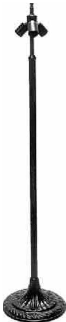
13 816 00 CLASSIC 2 A/B: 1380 / 1170 mm C: 300 mm