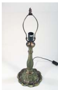
13 710 00 Zink Fuß 325M 38,0 cm mit Elektrik Zinc base 325M 15,0" wired