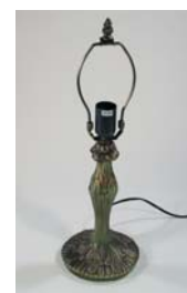
13 706 00 Zink Fuß 311 46,0 cm mit Elektrik Zinc base 311 18,1" wired