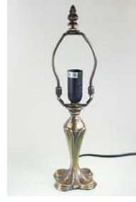
13 715 00 Zink Fuß 345 S 28,5 cm mit Elektrik Zinc base 345 S 11,2" wired