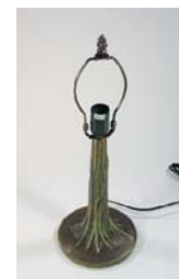
13 709 00 Zink Fuß 324 A 49,0 cm mit Elektrik Zinc base 324 A 19,3" wired