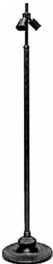
13 815 00 CLASSIC I A/B: 1370 / 1150 mm C: 300 mm