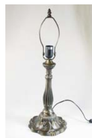
13 703 00 Zink Fuß 305 59,0 cm mit Elektrik Zinc base 305 23,2" wired