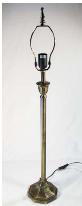
13 731 00 Zink Fuß TB-105 86,0 cm mit Elektrik Zinc base TB-105 33,9" wired