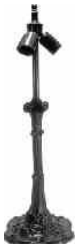
13 802 00 DUFFNER & KIMBERLEY A/B: 660 / 410 mm C: 230 mm