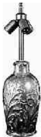
13 812 00 BRADLEY & HUBBARD 2 A/B: 610 / 360 mm C: 140 mm