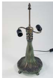
13 717 00 Zink Fuß 500 SB 56,5 cm mit Elektrik Zinc base 500 SB 22,2" wired