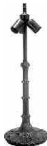
13 804 00 WILKINSON I A/B: 640 / 390 mm C: 210 mm