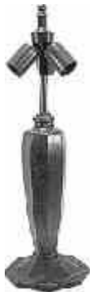
13 839 00 HANDEL 9 A/B: 550 / 370 mm C: 175 mm