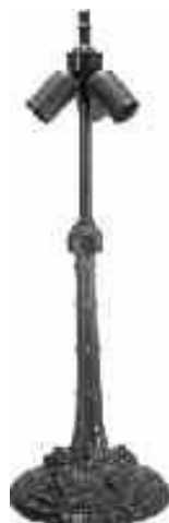
13 806 00 WILKINSON 3 A/B: 630 / 350 mm C: 220 mm