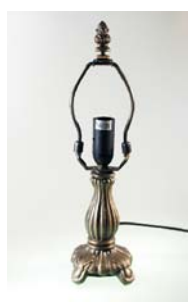
13 711 00 Zink Fuß 328 28,0 cm mit Elektrik Zinc base 328 11,0" wired