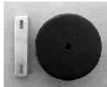
23 200 00 Baldachin für Halogen Canopy