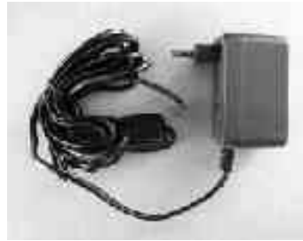
65 101 01 Steckertrafo mit Schalter u. Kabel, 20 Watt Plug transformer, switch, cord, 20 Watt