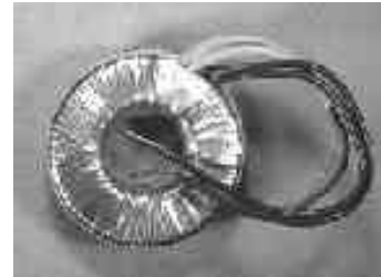
65 110 03 Ringkerntrafo, 12V, 50 Watt Transformer, 12V, 50 Watt