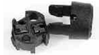
65 502 00 Halogenfassung, Kunststoff Halogen socket, synthetic