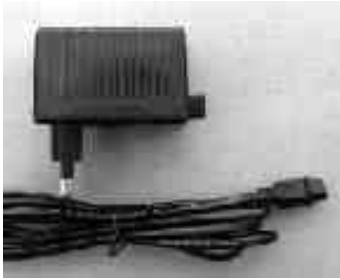
65 100 02 Steckertrafo mit Schalter u. Kabel, 50 Watt Plug transformer, switch, cord, 50 Watt