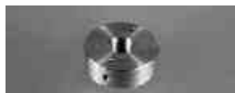
46 120 50 Halterung für NIRO-Seil NIRO wire holder