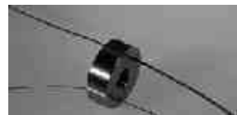
NIRO-Drahtseil / NIRO wire, 50 m 46 120 00 0,7 mm 46 121 00 1,2 mm