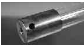
24 250 80 Messing Duranglas Halterset Brass Duran glassholder set