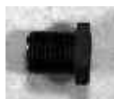
24 315 01 Trompetennippel, Kunstst., M10x1 Nut nipple, synth., M10x1