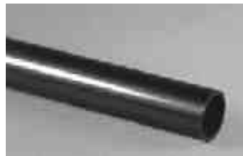
Kaschierrohr, messing Covering rod, brass