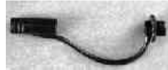
Harfe für Minifüße, brüniert