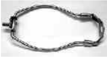
Harfe, messing / Harp, brass