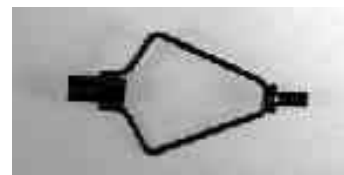
Harfe für Minifüße, brüniert