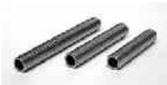
Gewinderohr, vermessingt, M10x1 Threaded rod, brass plated, M10x1