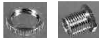
24 312 00 Rändelmutter M10x1 Knurled nut M10x1