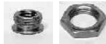
24 301 00 Reduzierer von M10 auf 1/4" Reducer from M10 to 1/4"