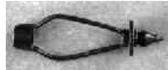
Harfe für Minifüße, brüniert