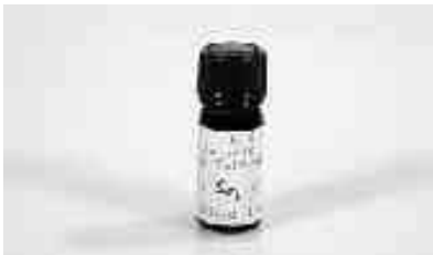
54 300 02 Glanzgold / Liquid gold, 5 gr.