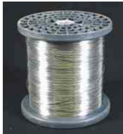
35 290 05 Kanthaldraht / Kanthal wire