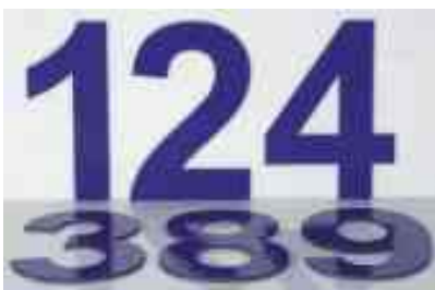
35 250 00 - 35 259 00 Glaziffern / Glass numerals