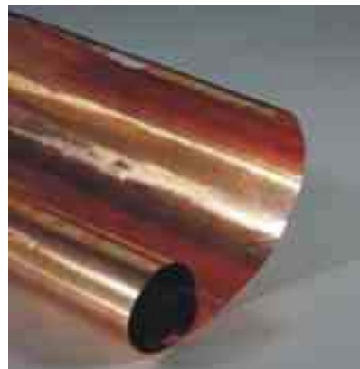
41 500 00 Kupferfolie / Copperfoil

Der Glaseinlegedraht wird normalerweise als Zwischenlage bei Drahtglas verwendet. Beim Fusen ist dieses Material als Dekor- oder Sicherheitselement verwendbar.