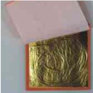
35 301 00 Echtes Blattgold / Genuine gold leaves, 22 Karat