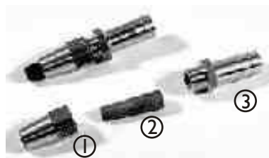
Überwurfmutter / Nozzle cap, Strahldüse / Nozzle, Schlauchverschraubung / Threaded hose coupling