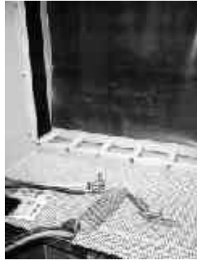
Innenansicht / Inner sight

Sandblasting enclosure with exhaust, footswitch and illumination either in front of or behind the piece to be worked. Further technical details not available before catalog went to print. Please ask for details.