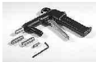
5I 315 01 Strahlpistole für alle Drucksysteme Air gun for all pressure systems