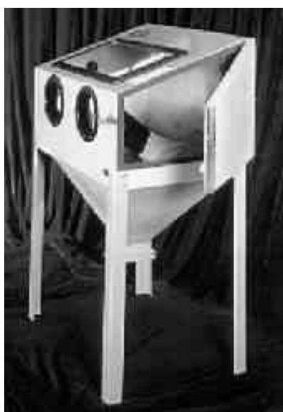
51 315 00 GLASTAR-Kabine / Cabinet 2533

51 315 00 GLASTAR Sandstrahlkabine 2533 GLASTAR Sandblasting cabin 2533