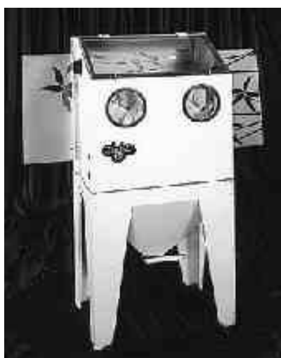
51 316 00 GLASTAR-Kabine / Cabinet "PASSER 2"

51 316 00 GLASTAR Sandstrahlkabine MINI PASSER GLASTAR Sandblasting cabin MINI PASSER