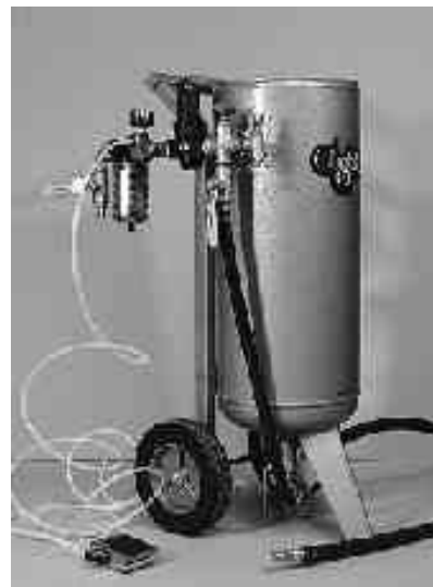
5I 302 00 Druckbehälter / Pressure pot, 100 S

5I 302 00 GLASTAR-Druckbehälter / Pressure pot, 100 S Inhalt / Content: 45 ltr., mit Fußschalter / Footswitch