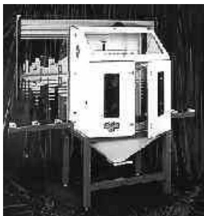
51 314 00 GLASTAR-Kabine / Cabinet "PASSER 1"