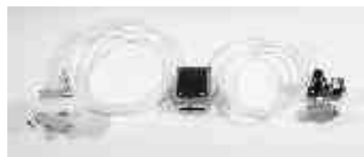
5I 305 00 Fußschaltersystem / Foot switch system

5I 629 00 Druckluftschlauch / Pressure tube, 9 x 3 mm, PVC