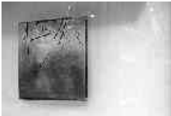
Beispiel / Example