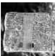
Beispiel / Example

50 911 00 Acrylat Filmkleber / Acrylic tape hochtransparent, für hohe Anforderungen, innen und außen einsetzbar. Verklebt Glas, Acrylglas, Metall, Keramik, hochenergetische Kunststoffe. UV-beständig. Temperaturbereich: -40° + 150° C, Filmstärke 0,5 mm. high transparent, for extra high quality, indoor and outdoor. Bonds glass, acrylic glass, metal, ceramics, high energetic synthetics. UV-resistant. Temperature from -40° to + 150° C, Thickness 0,5 mm Maße / Measurements: auf Anfrage / by request