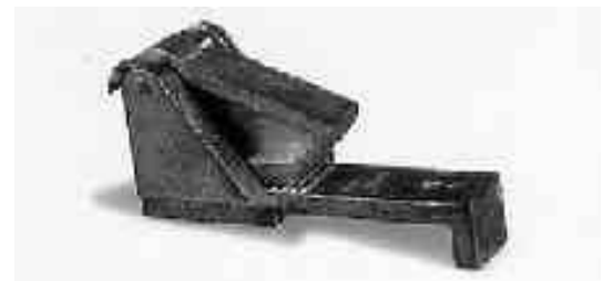
36 300 00 Blei-Strecker / Lead stretcher Alu mit Feder / spring