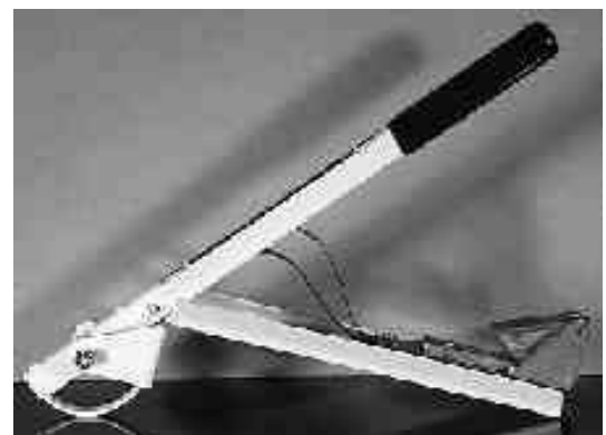
36 301 00 Blei-Strecker / Lead Stretcher "GLASTAR"