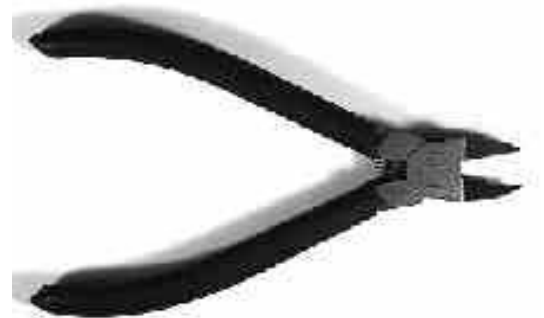
32 170 00 Blei-Seitenschneider / Lead came cutter PLP 7