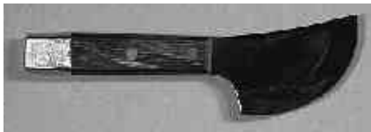
36 305 10 CORTELLO SLK 1, Midi Bleimesser mit 1/4 Kreis-Klinge / Lead knife with 1/4 circle blade