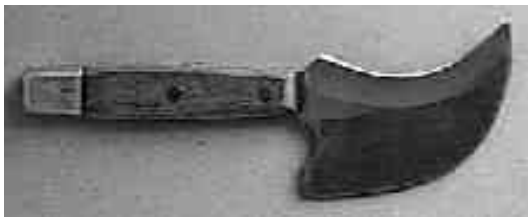
36 305 20 CORTELLO SLK 3, Maxi Bleimesser mit 1/4 Kreis-Klinge / Lead knife with 1/4 circle blade