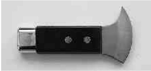
36 305 00 CORTELLO SLK 2 Bleimesser mit Trennklinge / Lead knife with cut blade