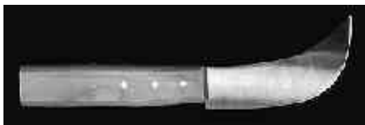
36 306 00 Bleimesser mit Sichel-Klinge / Lead knife with banana blade