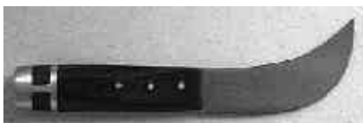
36 310 00 Bleimesser / Lead knife mit Bleianguß / with lead end