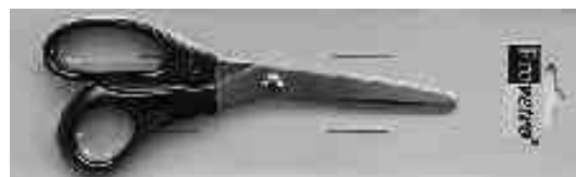
PROVETRO SCHABLONENSCHERE PROVETRO PATTERN SHEERS 36 205 00 für Folie / for foil 36 210 00 für Blei / for lead

The pair of stencil scissors produces a narrow stripe marking the corresponding work area of film and/or the lead while cutting. Thereby, the produced object is not created larger than the pattern.