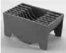
36 130 00 FOLIENBOX / FOIL DISPENCER für 7 Rollen mit unterschiedlichen Breiten for 7 rolls with different sizes