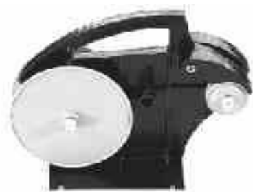
36 140 00 FOLIENANROLLER / FOILER GLASTAR