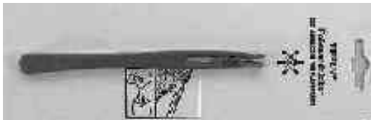
36 110 00 FOLIENANDRÜCKER FOIL BURNISHER für alle Breiten / for all sizes