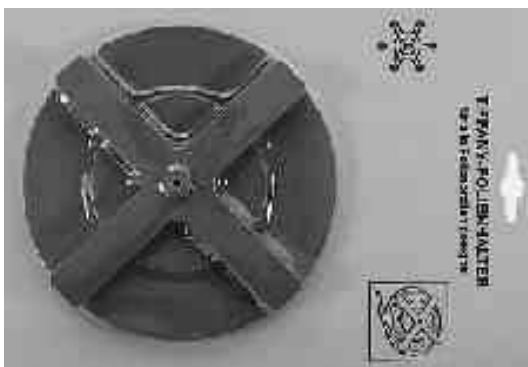
36 100 00 FOLIENHALTER FOIL HOLDER für 1 Rolle (alle Breiten) / for 1 roll (all sizes)