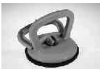
36 600 00 Saugheber / Suction jack Kunststoff / Synthetics trägt / carries 20 kg