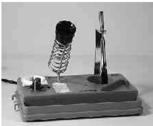
36 132 00 Lötstation mit Temperaturregelung und Lötkolbenhalter Soldering Station with heat controller and iron stand