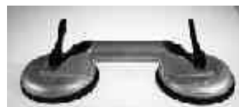
36 602 00 Saugheber / Suction jack Aluminium, 2-Kopf/2-head trägt / carries 70 kg