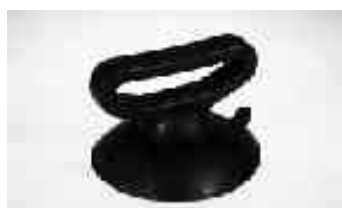
36 605 00 Saugheber / Suction jack Gummi / Rubber trägt / carries 30 kg