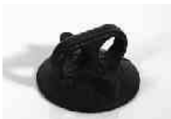
36 601 00 Saugheber / Suction jack Gummi / Rubber trägt / carries 20 kg