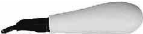
31 125 00 Hobby Long Life 424.0 SW 120°, HM, Längenverstellbarer Kunststoff-Schaft Adjustable length plastic shaft