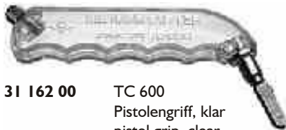
31 162 00 TC 600 Pistolengriff, klar pistol grip, clear