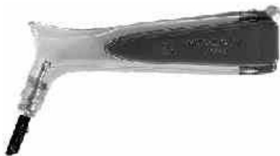
31 298 00 M700 mit Pistolengriff / pistol-Cutter

ERSATZKÖPFE für alle MITSUBOSHI-Modelle REPLACEMENT HEADS for all MITSUBOSHI cutters