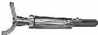
31 163 00 TC 9P Thomas Grip Rainbow Schaft neonfarben / neon colored grip