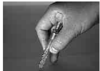
Handhaltung beim TOYO TC 9P Using the TOYO TC 9P

All Toyo glass cutters have a cutting angle of 134°.