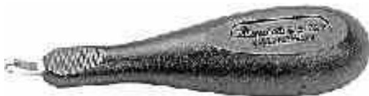
31 127 00 Easy Grip 128.01 SW 120°, ST, mit Gleitschuh / with sliding block